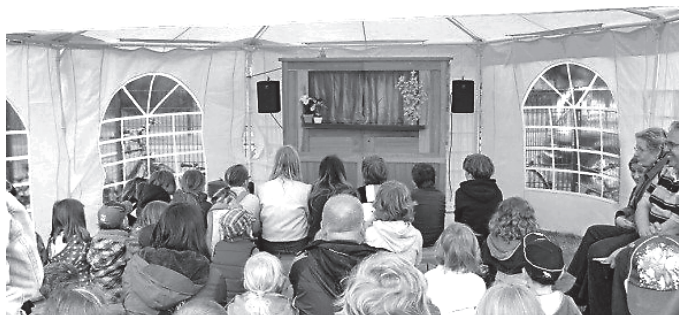
Kinderfest Rüdnitz 2012 Vorstellung der Potsdamer Puppenbühne

so zum Erhalt des einmaligen Baudenkmals beitragen will. Es ist also für alle Rüdnitzer Einwohner etwas dabei. Leider ist es auch 2012 nicht gelungen, die Altersgruppe der 20- bis 50jährigen für diesen Teil des Dorflebens zu begeistern. Dies wird in den kommenden Jahren sicherlich zu den Schwerpunkten gehören. Die traditionell stattfindenden Feste (Kinderfest, Dorf- und Schützenfest, Herbstfest, Martinsfest) sollen dazu genauso beitragen wie die vielen sonstigen Veranstaltungen, die über das Jahr verteilt stattfinden. Der Kultur- und Sozialausschuss der Gemeinde hat im Oktober 2012