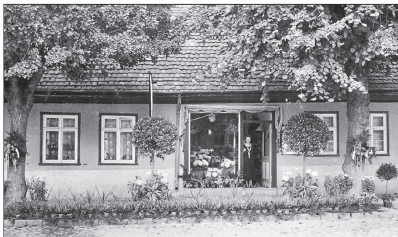
Breite Straße 18, Handwerkerfest 1933. Zu diesem Fest war Biesenthal überaus festlich geschmückt.