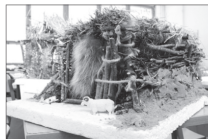
Projektarbeit – Haus aus der Jungsteinzeit

Es berichtet die 5a: Am 28. Januar um 14.00 Uhr fand im Musikraum der diesjährige Lesewettbewerb statt. Es gab 15 Teilnehmer, die jeweils drei Minuten lesen mussten. Auch Zuschauer waren da, um den Teilnehmern den Rücken zu stärken. Nach jedem Beitrag gab es begeisterten Applaus. Es gab gute Ergebnisse, von denen nur sechs ausgezeichnet werden konnten. Die kleinen Leser der dritten und vierten Klassen stellten interessante Bücher vor, unter anderem auch „Der kleine Drachen Kokosnuss“ oder „Zottelkralle“. Die Sieger und Platzierten wurden am 29. Januar geehrt.