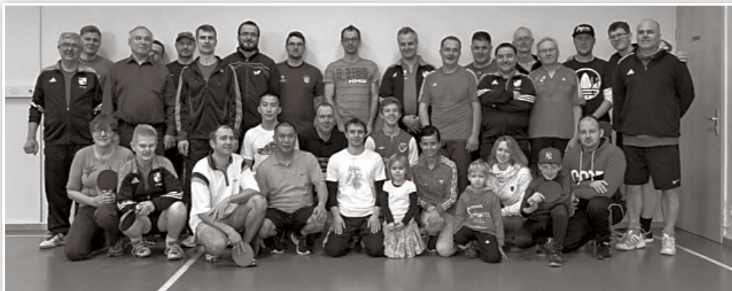
Teilnehmer Weihnachts TT Turnier des SV Melchow / Grüntal

Auch im Jahr 2015 gab es wieder ein „Nachweihnachts-Tischtennisturnier im Melchower Begegnungszentrum am 27. Dezember. Die Resonanz war diesmal noch größer als 2014. Das als Verdauungsaktion nach den Feiertagen gedachte Treffen der Sportler des SV Melchow/Grüntal wurde schon mit Vorfreude erwartet. Deshalb der Gedanke, wir spielen in diesem kleinen Turnier um einen Wanderpokal. Genau genommen um zwei Pokale. Einmal aus dem Bereich der aktiven Tischtennispieler und zum anderen spielen die Sportler anderer Abteilungen und Angehörige um den Pokal der Freizeitsportler. Insgesamt konnten wir 29 Teilnehmer registrieren und in Gruppen aufteilen, wo jeder gegen jeden spielte. Die ersten beiden kamen jeweils weiter und dann wirkte im Viertel – und Halbfinale das K.-o.-System. Spaß und Freude