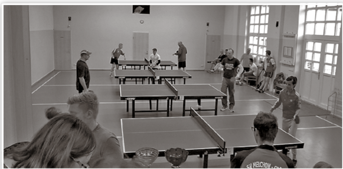
Die Spieler in Aktion