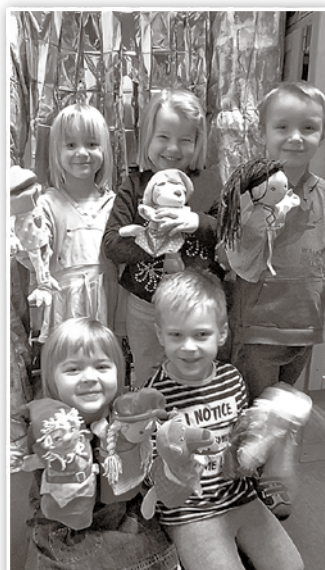
Die Schmetterlinge der Kita Knirpsenland