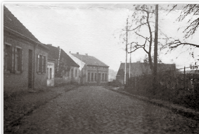
Ganz links – Fischerstr.10. – Letztes Haus links Winkelmann