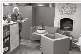
Neu gestaltete Tourist Information im Alten Rathaus

Ein Panoramafoto vom Naturschutzgebiet Biesenthaler Becken sowie drei beeindruckende Landschaftsfotos der Biesenthaler Umgebung erfreuen den Besucher und regen ihn an, Auskünfte über diese Orte zu erfragen.