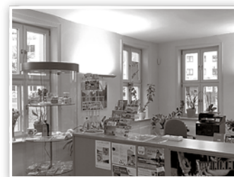
Ansprechende Souvenirgestaltung in der Tourist Information

Ansichtskarten zu schreiben und wahrscheinlich demnächst auch Informationen im Internet per i-Pad suchen zu können. Ergänzt wird die Sitzzecke noch durch eine kleine Kinderspielecke.