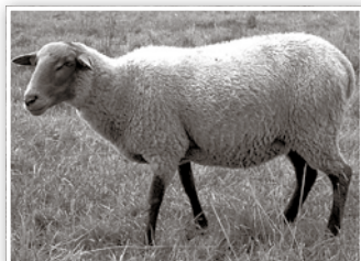
Ein Coburger Fuchsschaf

Das Coburger Fuchsschaf – eigentlich eine Schafrasse der deutschen Mittelgebirge – ist seit ein paar Jahren auch in Biesenthal heimisch. Die Rasse, von der es nur noch wenige, vor allem in Süddeutschland verbreitete Bestände gibt, wurde von der "Gesellschaft zur Erhaltung alter und gefährdeter Haustierrassen (GEH) e.V." auf die Vorwarnliste der vom Aussterben bedrohten einheimischen Schafrassen gesetzt. In Brandenburg findet man diese hübschen Schafe nicht oft.