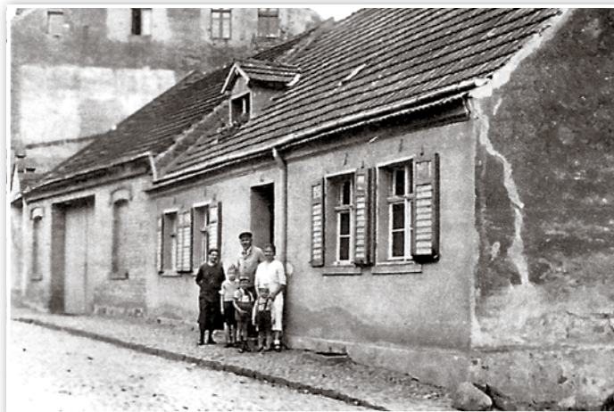
Fischerstraße 10 August 1940