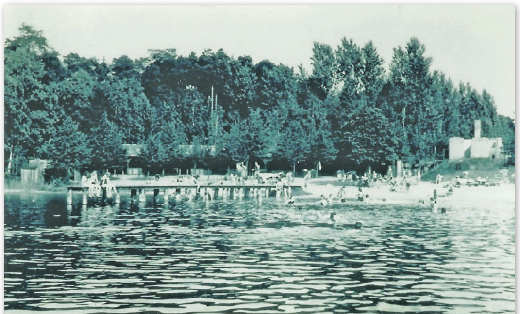
Ganz rechts die Ruine der einst so schönen Gaststätte, die auf Grund von Nazisymbolen beim Einmarsch der Roten Armee angezündet wurde. Aufnahme vom Juli 1945