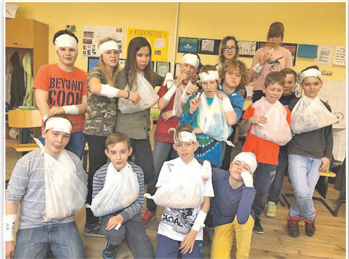
Klasse 6 bei der Ersthelferausbildung

Der Förderverein der Grundschule Marienwerder e.V. hat zusammen mit dem Lehrerteam den Entschluss gefasst, ab dem Jahr 2017 alle zwei Jahre den Klassenstufen 5 und 6 eine „Ersthelferausbildung für Schüler“ zu finanzieren.