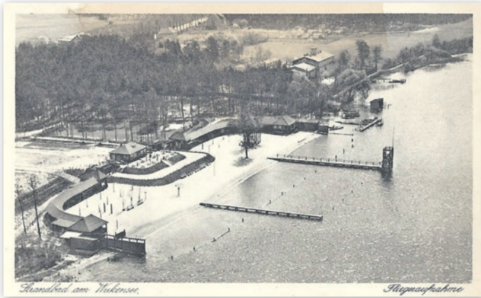
Luftaufnahme der Strandbadanlagen von 1932. Rechts der 1927 erbaute Sprungturm.