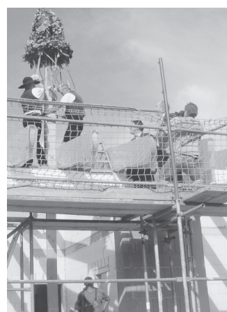
Der Neubau der Kita Schützenstraße feierte am 22. September Richtfest und wird in diesem Jahr fertig gestellt.