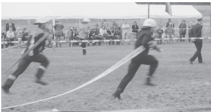
Am 27. Juni 2009 fand das traditionelle Amtsfeuerwehrfest bereits zum 15. Mal statt und lockte viele Interessierte nach Tuchen-Klobbicke.