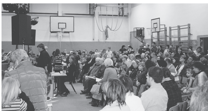
Großer Beliebtheit erfreut sich das jährlich stattfindende Kulturfest in der Grundschule Grüntal, 2009 unter dem Motto: Die Jahresuhr