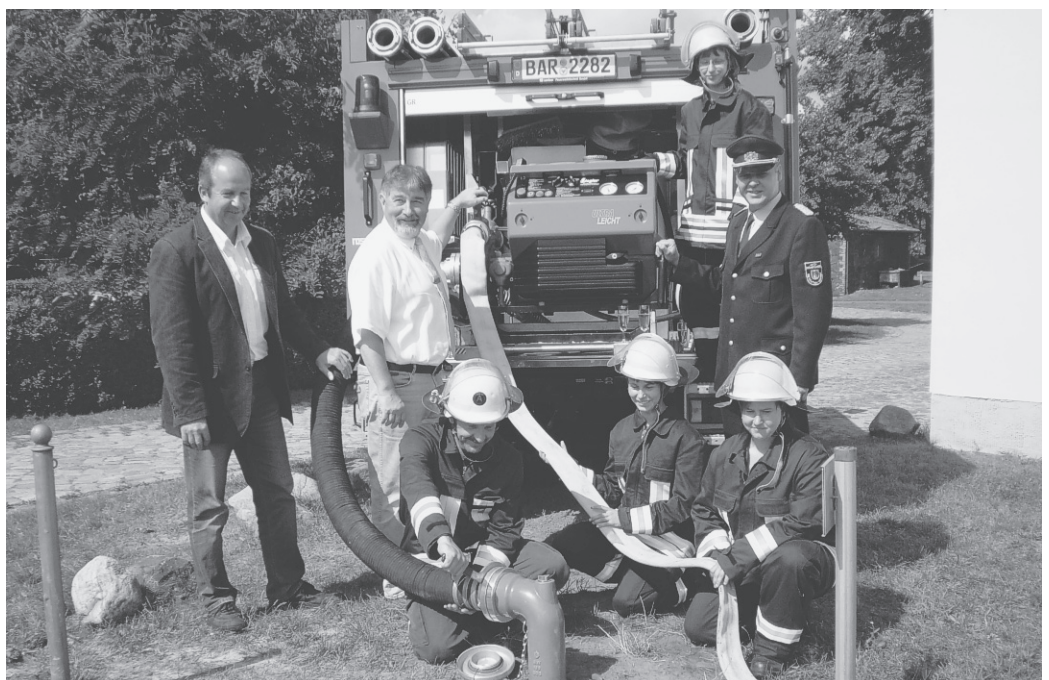
Am 4. August 2009 wurde der erste Bauabschnitt in Sachen Feuerlöschbrunnen (Flachspielgelbrunnen) abgeschlossen. Für den zweiten BA (Tiefbrunnen) wurden im Jahr 2010 Mittel eingestellt.