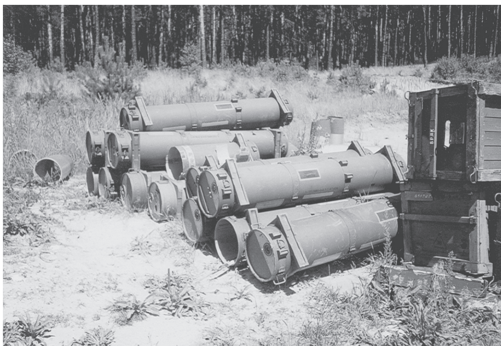
Hinterlassenschaft der GUS-Truppen. Ein „kleiner Ausschnitt“ vom Schrottplatz. Bombentransportbehälter rechts daneben die dazugehörigen Bombenkisten.

Nach der Besetzung durch die russische Armee wurden Biesenthaler und Leute der Umgebung zur Arbeit auf dem Gelände herangezogen. Sie mussten Bomben entrostern, Munition und Waffen sortieren, verpacken und verladen. Das Objekt wurde durch die Russen zu gleichen Zwecken genutzt. Die Verbindung zum Flugplatz Finow, der ebenfalls von den Russen besetzt war, wurde weiter aufrecht gehalten. Weiterhin wurde das Vorwerk auch als Bombenlager betitelt. Das Gelände reichte der russischen Armee später nicht mehr aus – die Besatzer eigneten sich noch ein umliegendes Waldgelände von Biesenthaler Ackerbürgern an, wodurch das Objekt zielgerichtet erweitert werden konnte und zu einem kleinen Ort mit vollkommener Selbstversorgung heranwuchs. So entstanden zwei Werkteile – das Bombenlager und ein Kfz-Lager, eine Tankstelle, eine neue Flugzeughalle für die Montage von Flugzeugen und eine Wasseraufbereitungsanlage mit mehreren Kesselanlagen, die auch nach Abzug der Truppen der GUS-Staaten voll funktionsfähig war. Das gesamte Gelände war von einer so genannten