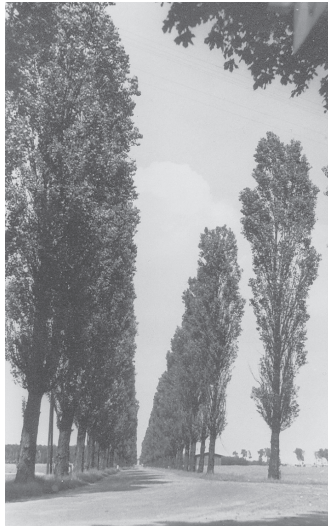
Die einst so schön angelegte Finower Chaussee. Rechts und links von Pappeln begrenzt. Jetzt Telekomstraße leider ohne Baumbestand

Laufstraße umgeben, auf welcher ständig Hunde und Wachhabende patrouillierten, auch die üblichen Wachtürme, bekannt von anderen Militärgeländen, waren vorhanden. 1972 erbauten die Russen ein großes Kulturhaus aus Sandsteinen. Hier war auch ein Kinosaal vorhanden. Am Giebel befand sich die Jahreszahl der Erbauung. Mitten auf dem Gelände steht ein 4-stöckiger Wach- und Feuerwehrturm. Am Stabsgebäude ist eine große Landkarte angebracht, auf welcher sämtliche russischen Militärobjecte, die sich in der russischen Besatzungszone befanden, aufgezeichnet sind – mit eingetragenen Streckenabschnitten vom Vorwerk bis zu diesen Objekten in Kilometern und Stunden.