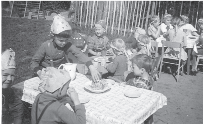
Kinderfest im Garten Thälmannstr. 24 in den 50er Jahren.

der NSV Ortsgruppe Biesenthal zugehörig war, wurde der Ernte-Kindergarten für die Mütter eingerichtet, welche überwiegend in der Landwirtschaft tätig waren. Der zweite Kindergarten wurde jedoch in erster Linie für die Kinder eingerichtet, deren Mütter aufgrund des Krieges in den Rüstungs- (Vorkrieg) und Wehrmachtobjekten der Stadt Biesenthal und Umgebung (z.B. Flugplatz Finow, Hundestaffel, Paula, Heideberg, Heidehof, Polizeischule, Kasernen in Bernau und Eberswalde) tätig waren.