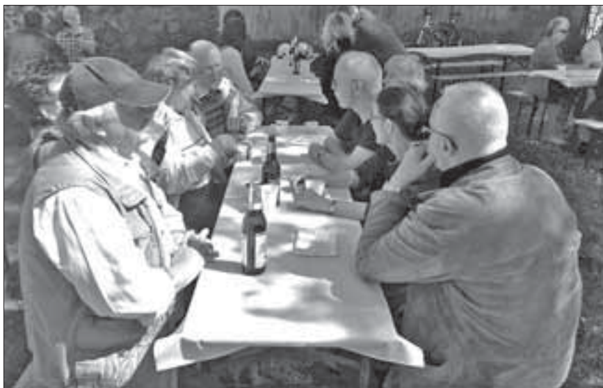
Frühschoppen auf dem Kirchplatz