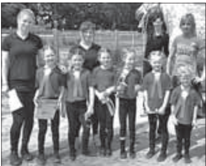
Die Minis mit ihren Trainerinnen und dem Pferd Grey

Unsere jüngsten Voltigierer, Mädchen im Alter von 4 bis 7 Jahren, bewiesen ihr Können in der Prüfung für Mini-Voltis. In dieser Prüfung dürfen die Jüngsten zeigen, ob sie bereits die turnerischen Fähigkeiten und die Sicherheit auf dem Pferd haben, um bei dem nächsten Turnier in der 1. Leistungsklasse E-Schritt