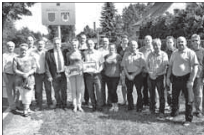
Gruppenbild vor der Partnerschaftstafel