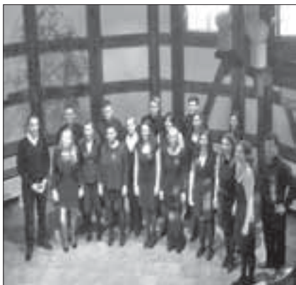
Der Chor Jeunesse im Konzert