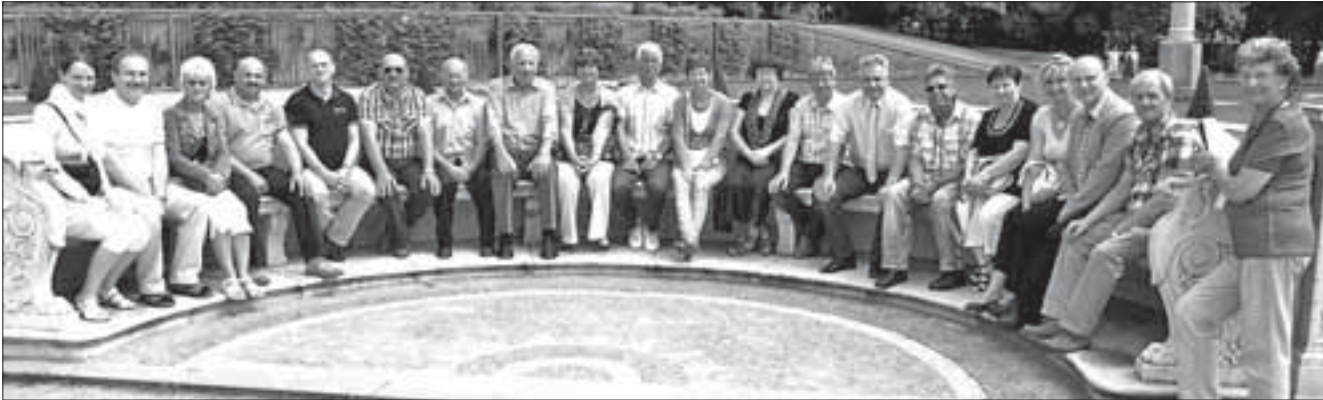
Besuch in Potsdam – Sanssouci

Besuch der polnischen Partnergemeinden Ryman und Dobra in Marienwerder