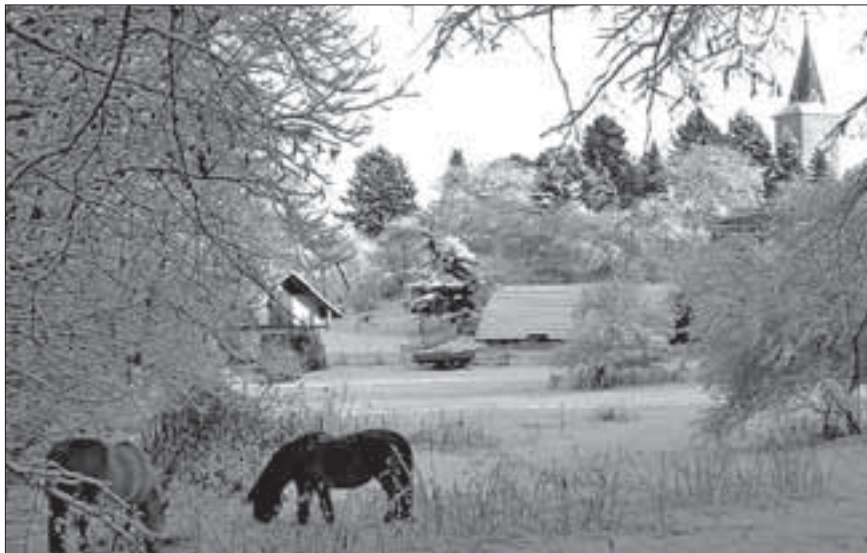
Weihnachtskarte Winteridylle am Biesenthaler Stadtrand.

Erhältlich in der Touristinformation im Alten Rathaus