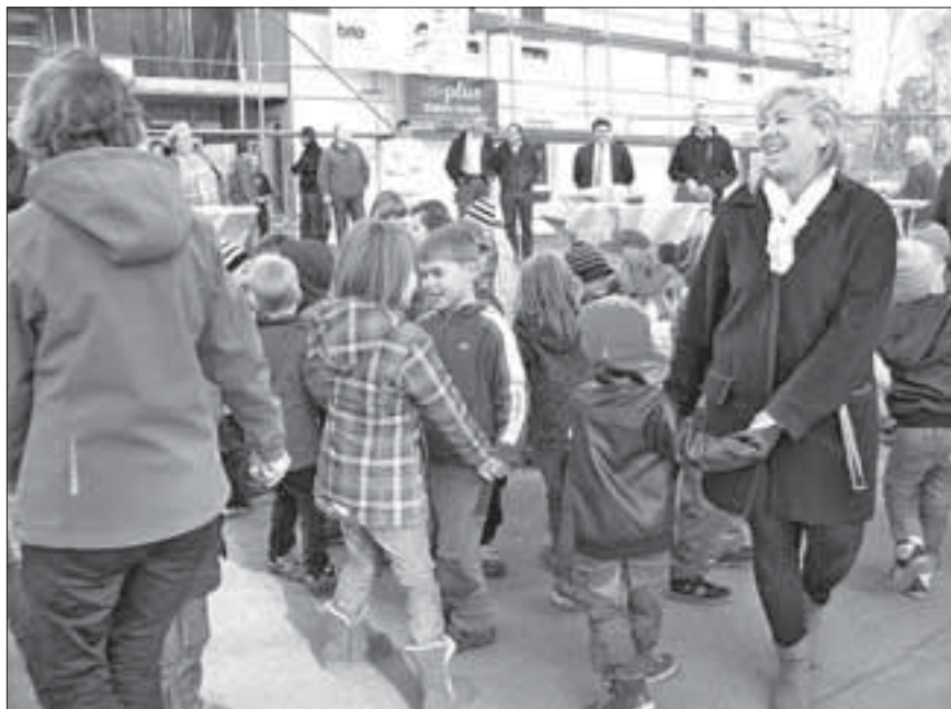
Kinder der Kita „Sankt Martin“ bei einer Aufführung beim Baustellenfest am 30. Oktober

In der Schützenstraße 44a am ehemaligen Standort der städtischen Kindertagesstätte wird seit dem Frühjahr gebaut. Hier entstehen 17 generationengerechte 1- bis 3-Raum-Wohnungen. Da in der Stadt Biesenthal insbesondere barrierefreie Wohnungen fehlen, erhält das Gebäude einen ebenerdigen Zugang und einen Aufzug. Damit sind alle Wohnungen auch für Personen mit Bewegungseinschränkungen geeignet. Die Wohnungen im Erdgeschoss weisen breitere Türen auf und sind speziell an die Bedürfnisse von Rollstuhlfahrern angepasst. Die Wohnungen haben eine Wohnfläche zwischen 36 und 66 m 2 . Alle sind mit einem innen liegenden Bad mit bodengleicher Dusche und stufenlos begehbare Terrasse bzw. Balkon ausgestattet. Je