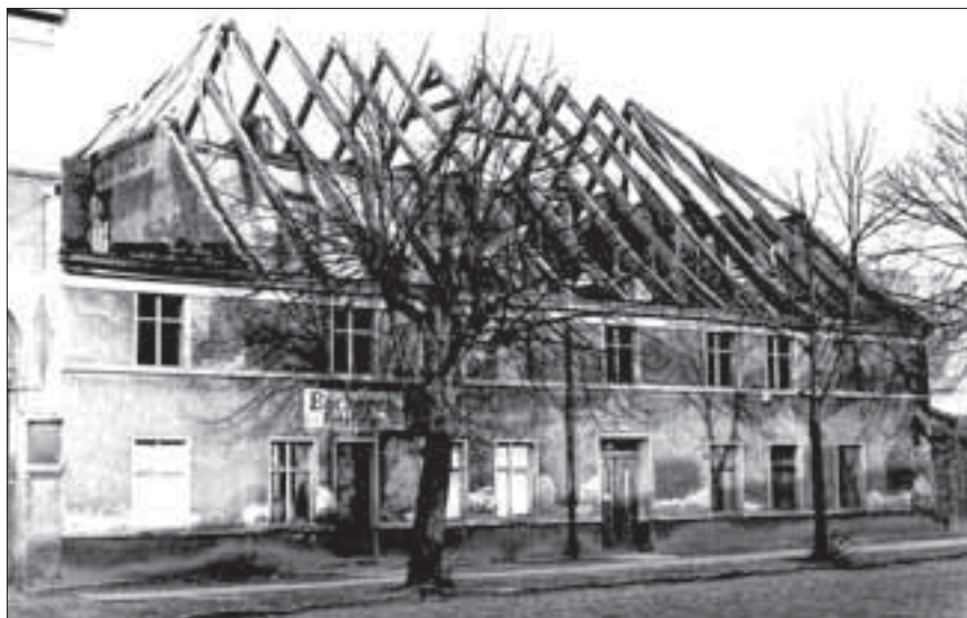
Nachdem die Bewohner das Haus räumten, wurde das Dach abgedeckt. Danach blieb die Ruine so einige Jahre bis zum Abriss in den 70er Jahren so stehen.