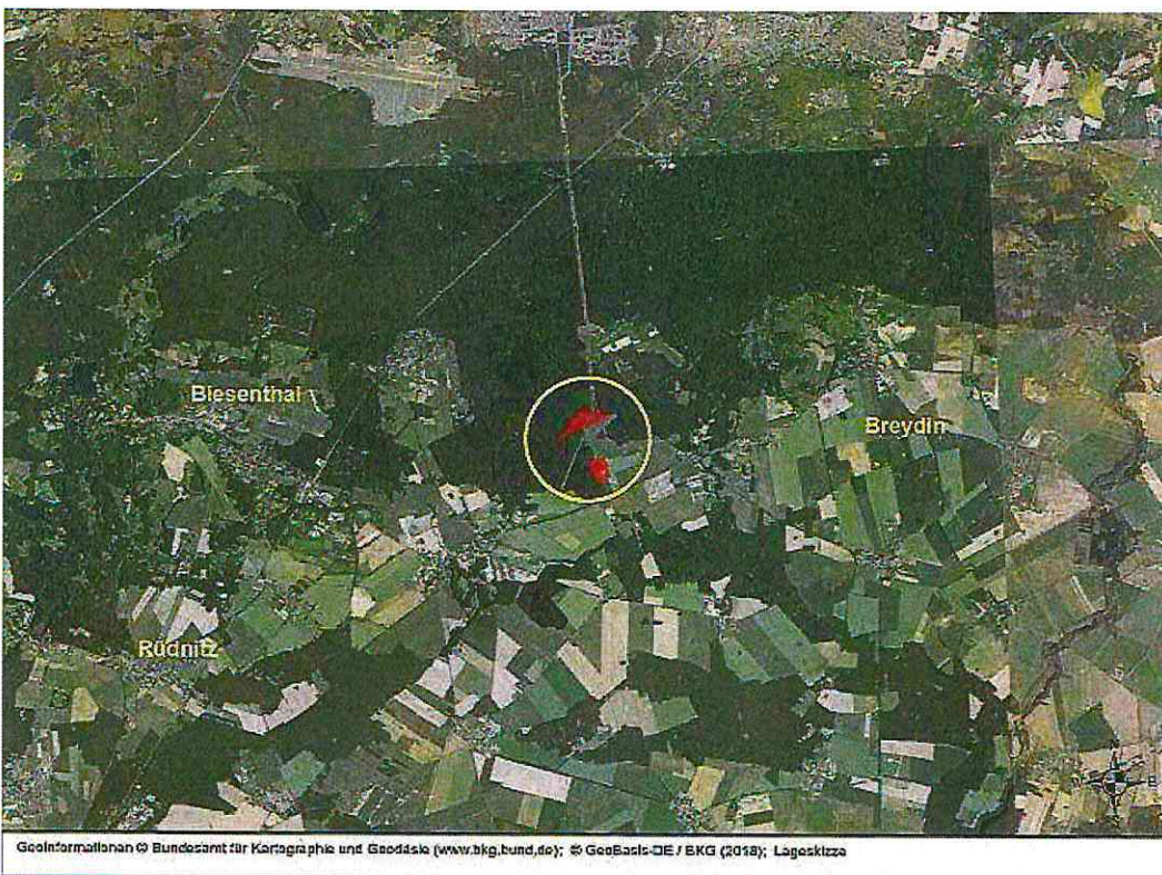
Übersichtsbild aus dem BVVG-GIS